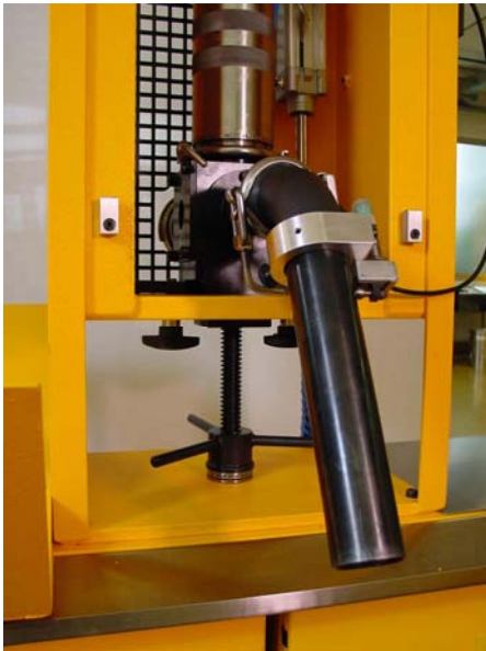
Abfüllrohr mit Kontaktschalter

Sobald der Dosierzylinder befüllt ist, schiebt der Bediener eine leere Kartusche über das Abfüllrohr bis der Kontaktschalter berührt wird. Hierdurch wird die Dosierung ausgelöst und die Kartusche wird befüllt.