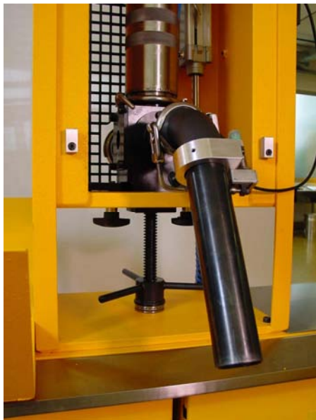
Abfüllrohr mit Kontaktschalter