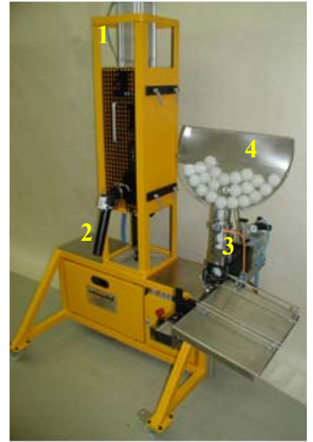
SD-H Version 1 für Dichtmassen, Klebstoffe und Fette