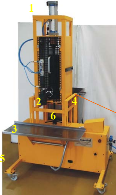
SD-H Version 3 für Druckfarbe