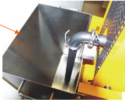
Vorratsbehälter mit Ansaugrohr