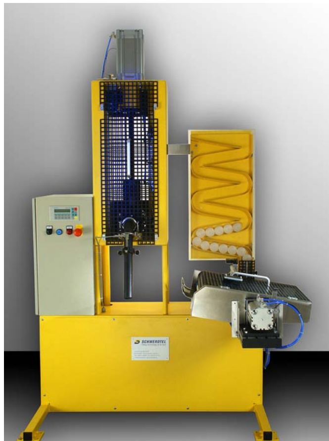
Halbautomatische Abfüll- und Verschließmaschine SD-H

zum Abfüllen von pastösen Produkten und Druckfarbe in Kartuschen und Dosen